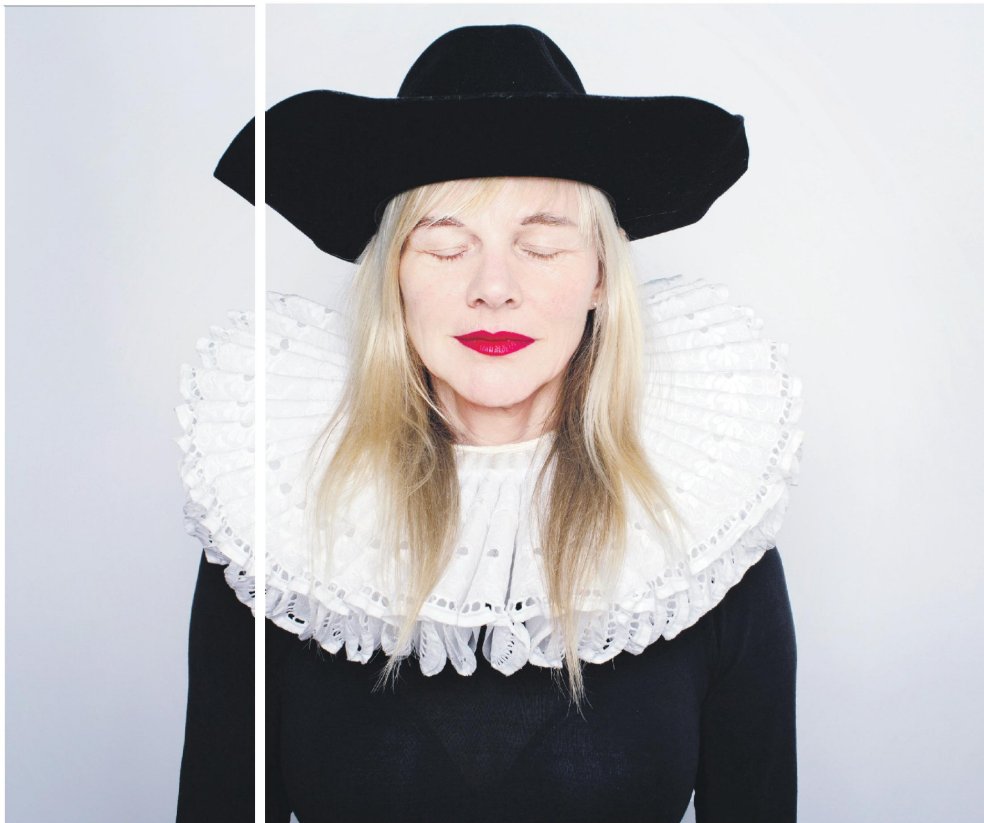
Dette Glashouwer (1960) is theatermaakster en actrice. Ze maakt solovoorstellingen over geld. 'Dette goes to Africa' is te zien op De Parade in Den Haag, Utrecht en Amsterdam.